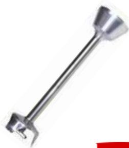
Mixovací tyč XL