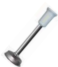
Tyč na puree