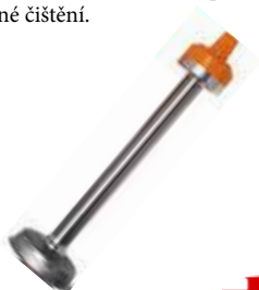
Tyč na puree

Jednoduše demontovatelné pro snadné čištění.