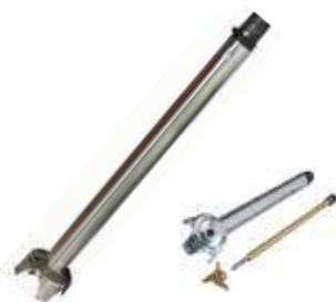
Mixovací tyč XL

Jednoduše demontovatelné pro snadné čištění.